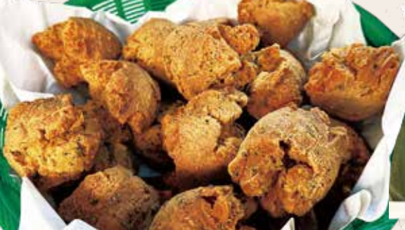
呉屋てんぷら屋 サーターアンダーギー