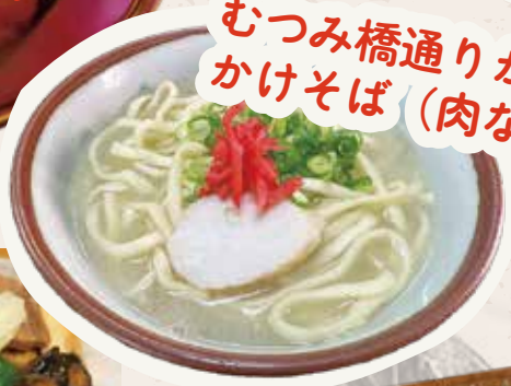
むつみ橋通りかどや かけそば(肉なし)