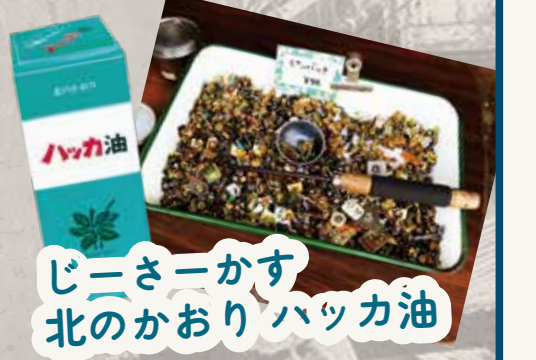
じんさいかす 北のかおりハッカ油