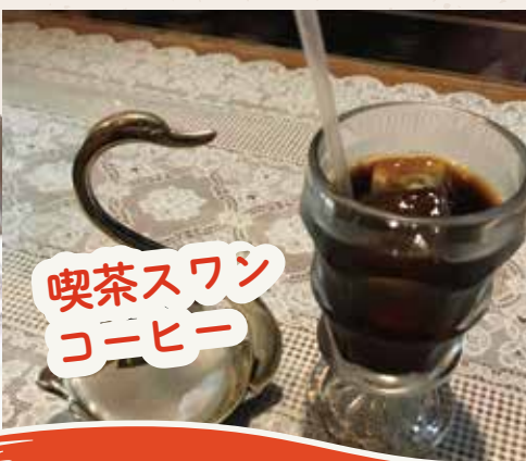
喫茶スワン コーヒー