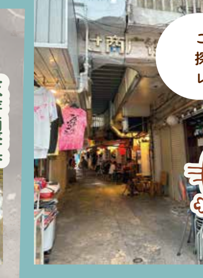
ここはどこ? 探してみよう レトロな風景