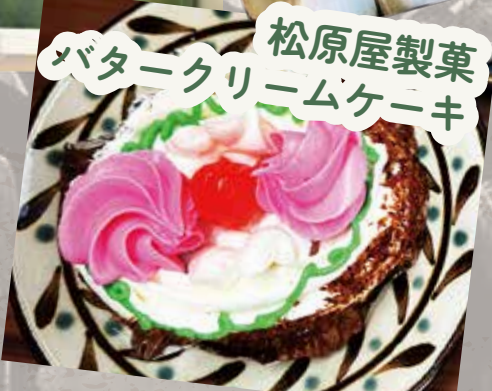
松原屋製菓 バタークリームケーキ