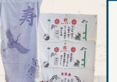
池原タオル 紅型ぶろしき