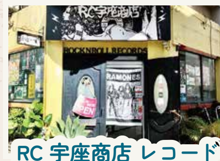
RC 宇座商店 レコード