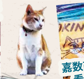
嘉数商会 看板猫みーちゃんグッズ