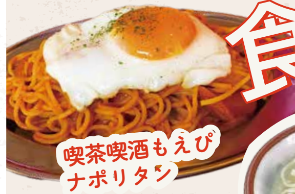
喫茶喫酒もえび ナポリタン