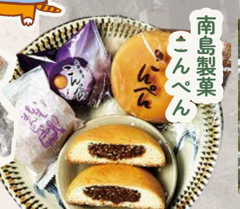
南島製菓 こんぺん