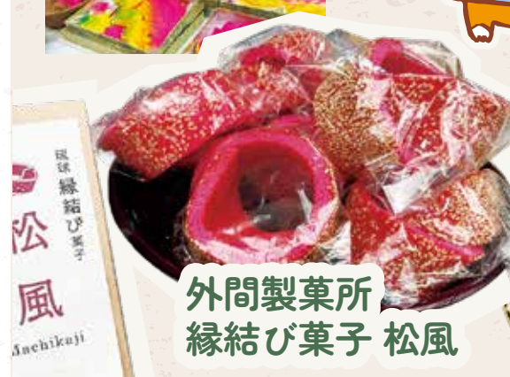
外間製菓所 縁結び菓子 松風