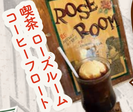
喫茶ローズルーム コーヒーフロート