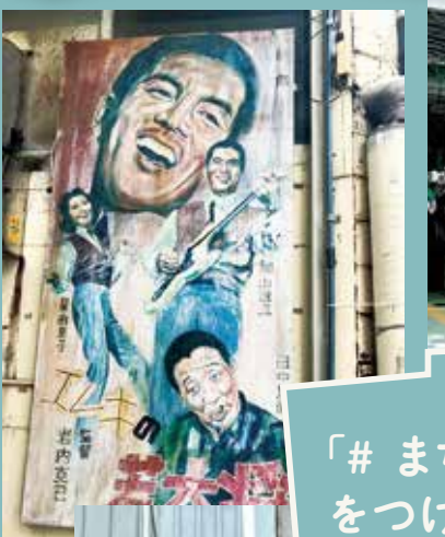
SNSに 「#まちぐわーレトロ」 をつけて投稿してね!