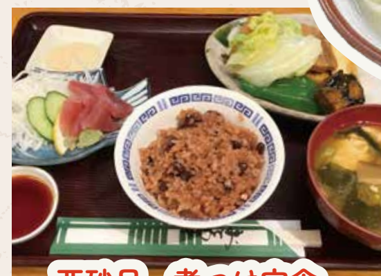
亜砂呂 煮つけ定食