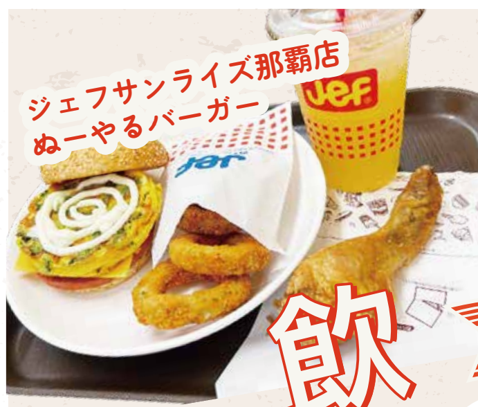
シェフサンライズ那覇店 ぬーやるバーガー