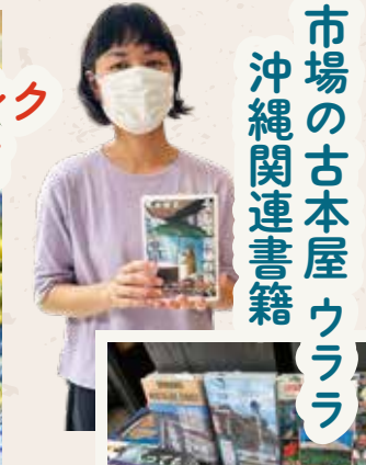
市場の古本屋ウララ 沖縄関連書籍