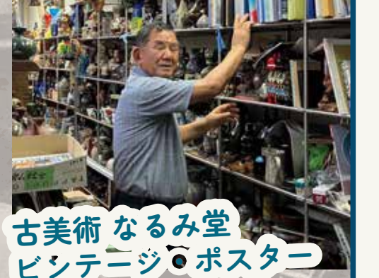
古美術 なるみ堂 ビシテニジ ポスター