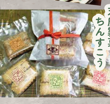
末廣製菓 ちんすこう