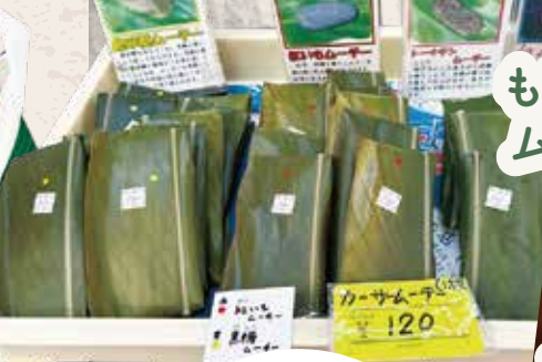
もちの店やまや ムーチー