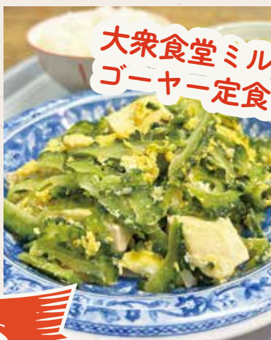
大衆食堂ミルク ゴーヤー定食