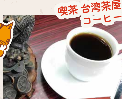
喫茶台湾茶屋 コーヒー