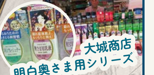
大城商店 明白奥さま用シリーズ